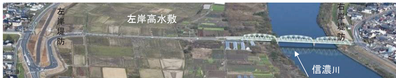
平常時 小須戸橋を上流より望む H22.10撮影