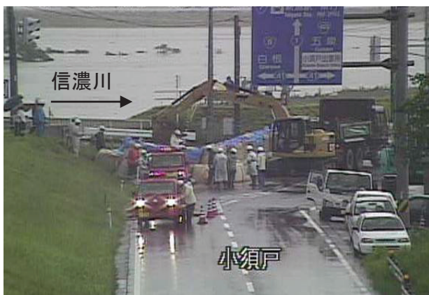
小須戸橋右岸の水防活動 撮影日:7/30