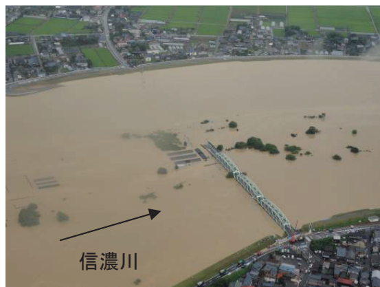
出水時の小須戸橋 撮影日:7/30