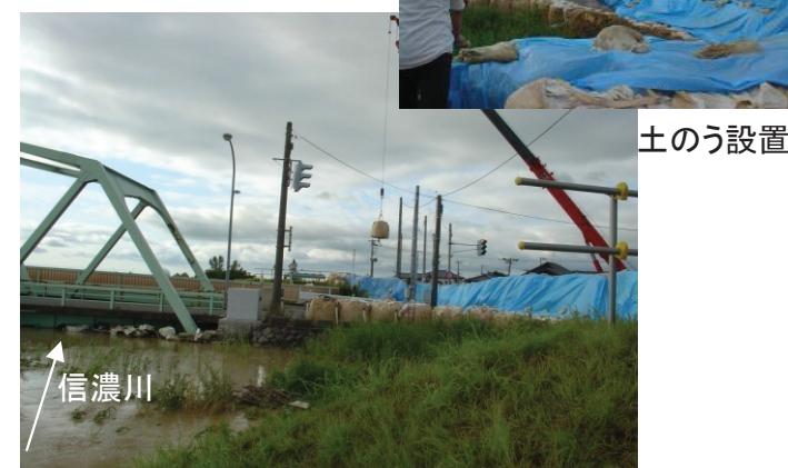
河川水位が上昇したため補強対策を実施 撮影日:7/30