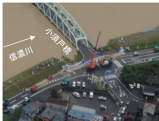
小須戸橋右岸の水防活動 撮影日:7/30