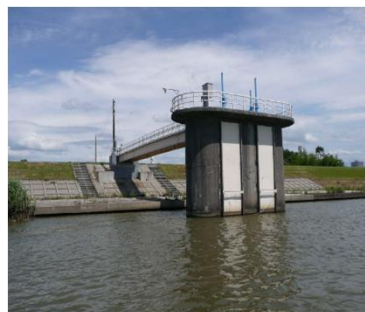
信濃川取水塔（新潟市水道局）