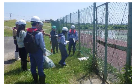
三条・燕総合グラウンド