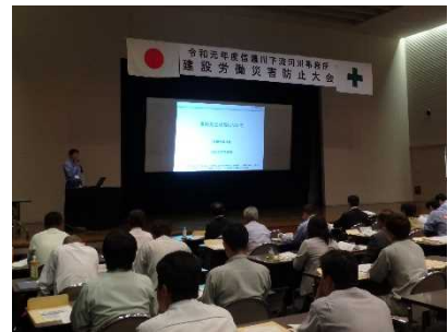
昨年度の建設労働災害防止大会