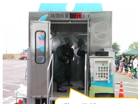
降雨体験コーナー もあります♪