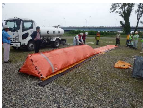
水防工法「水土のう工」 平成30年度の巡視状況