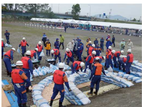
水防工法「月の輪工」