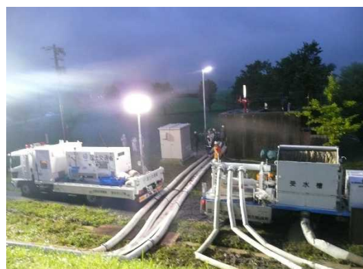
H23.7.29 加茂市下条下興野地先 排水ポンプ車、照明車 出動・稼働状況