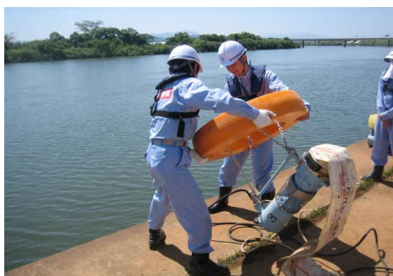
H30の職員による排水ポンプ設営訓練状況

日時：令和元年5月31日（金） 14:00～15:00（小雨決行） 場所：新潟市南区赤渋地先（赤渋防災船着場前） 別紙のとおり 使用機械：排水ポンプ車（30m 3 /min）1台、照明車（2kW×6灯,2柱式）1台