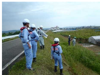
平成30年度の点検状況