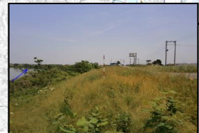
⑥天神林地先(堤防高、堤防断面不足)