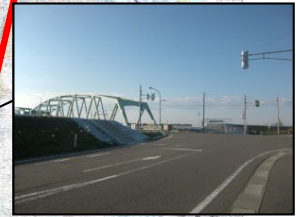
⑤小須戸橋右岸 (堤防高、堤防断面不足)