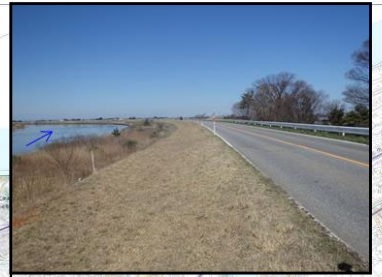
④花ノ牧地先(堤防高(流下能力)不足)