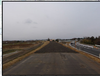
②庄瀬地先(堤防高(流下能力)不足)