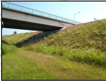
①信濃川大橋左岸 (堤防高(流下能力)、堤防断面不足)