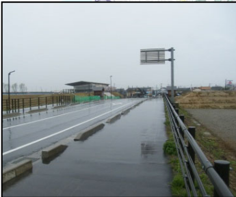
③瑞雲橋左岸(堤防高、堤防断面不足)