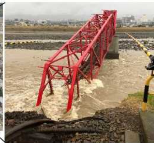
上田電鉄別所線千曲川橋梁 の落橋状況