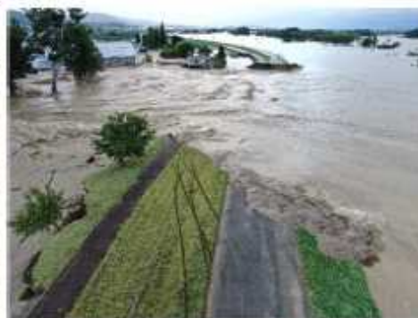
千曲川長野市穂保地区 堤防決壊状況