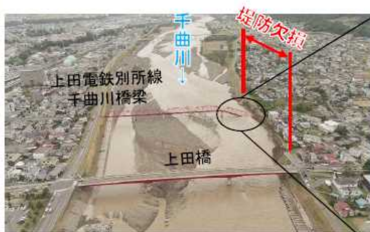
上田市諏訪形地区 被災状況