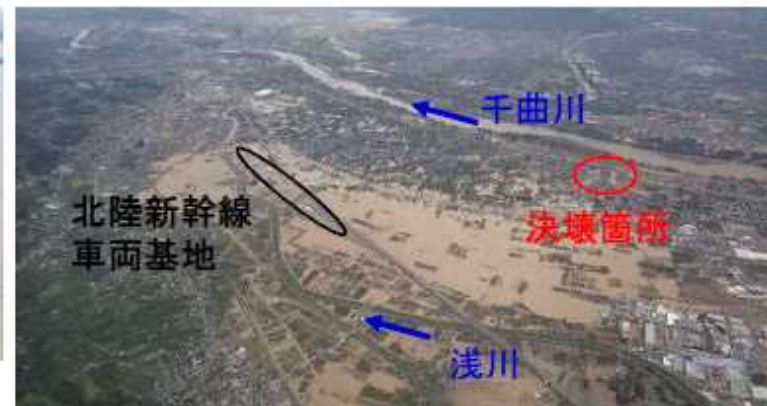
長野市穂保地区 浸水状況