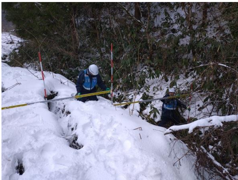
第5班 和島市 護岸被災状況調査