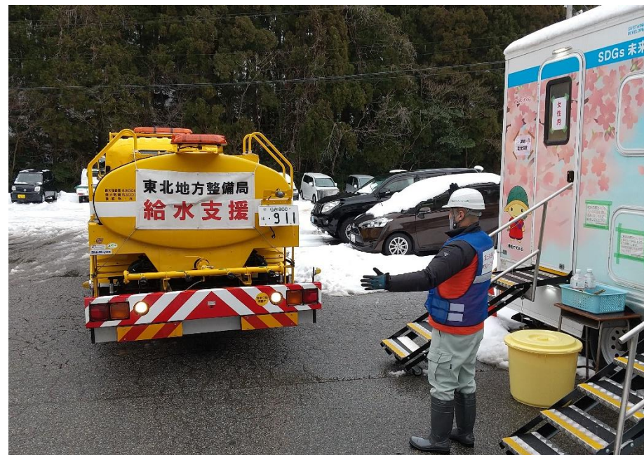
緑丘中学校への給水支援状況