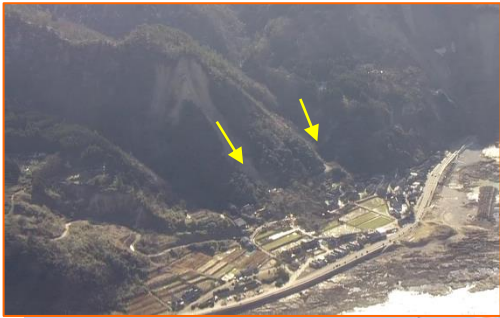
すずし にえまち ③石川県珠洲市仁江町 【道の駅す塩田村の西側】