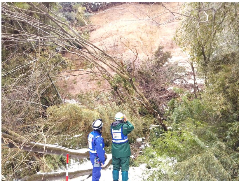
現地調査状況(輪島市門前町井守上坂)