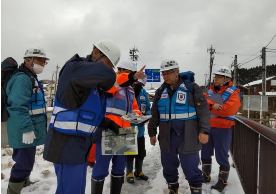
調査箇所現地踏査(珠洲市飯田町付近)