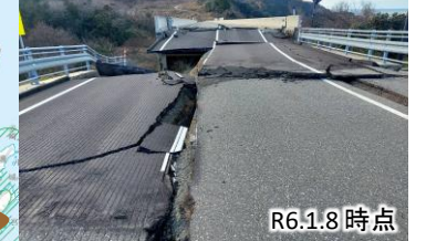
写真⑥ 国道249号大谷トンネル