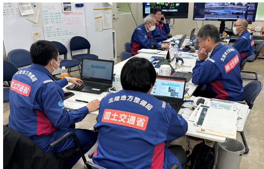
調査結果の取りまとめ