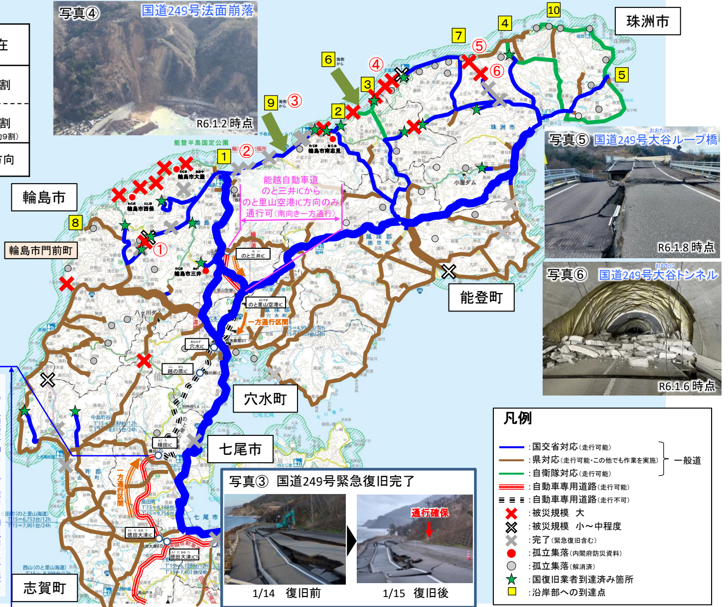
写真⑤ 国道249号大谷ループ橋