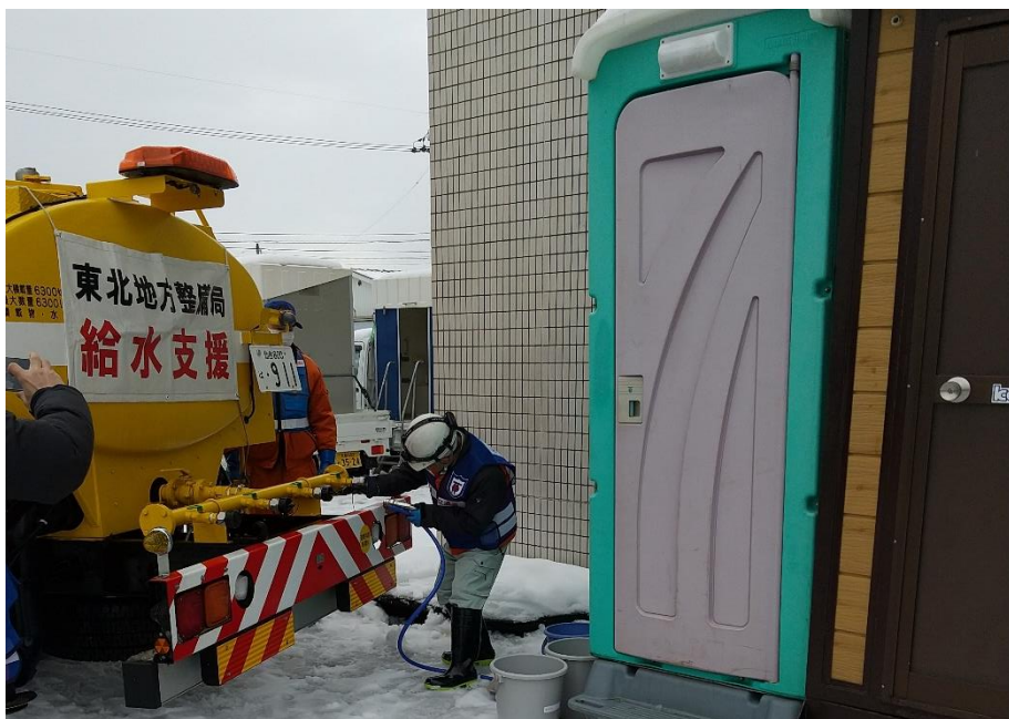
珠洲商工会議所への給水支援状況