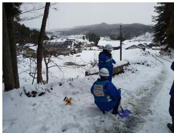
被災状況調査(能登町字柳田)