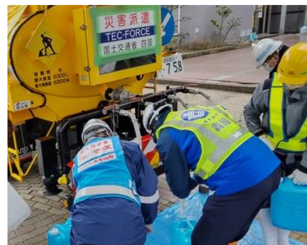
給水支援状況（富来活性化センター）