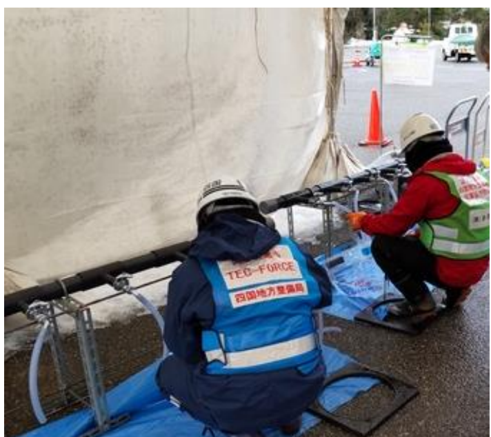
給水支援状況（志賀町文化ホール）