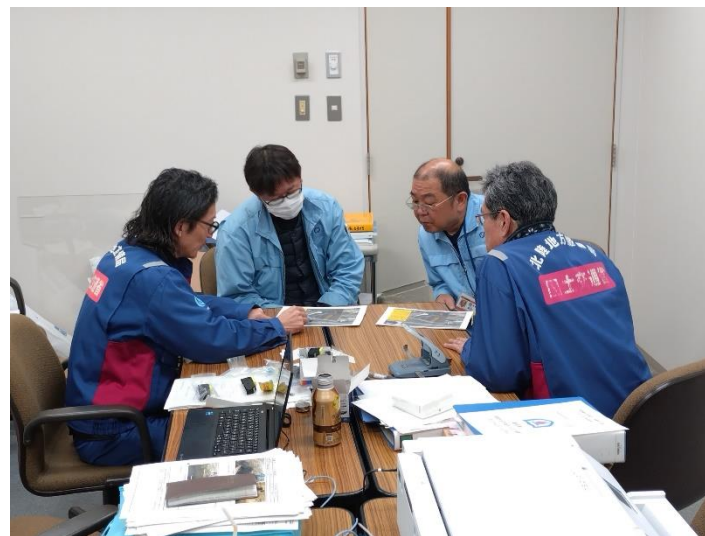
第2班 志賀町 被災状況説明