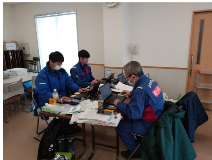
第3班 穴水町 内業作業状況