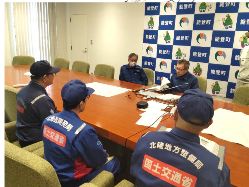
手交状況(石川県能登町)