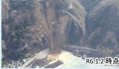
写真④ 国道249号法面崩落