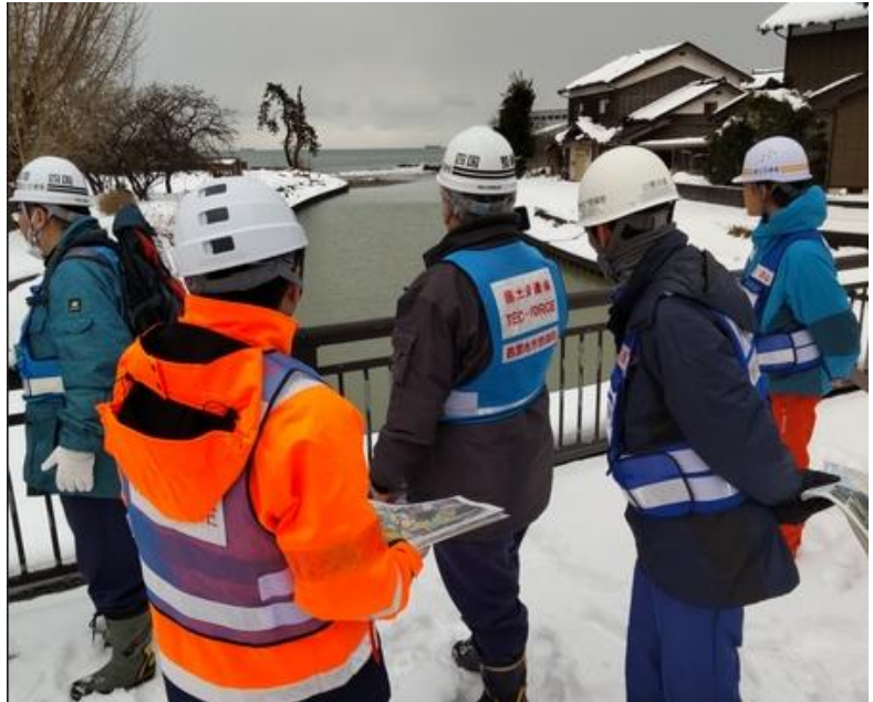
調査箇所現地踏査(珠洲市上戸町付近)