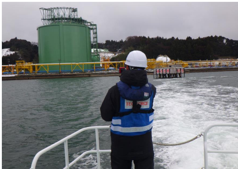
七尾港 被災状況調査(港湾業務艇)