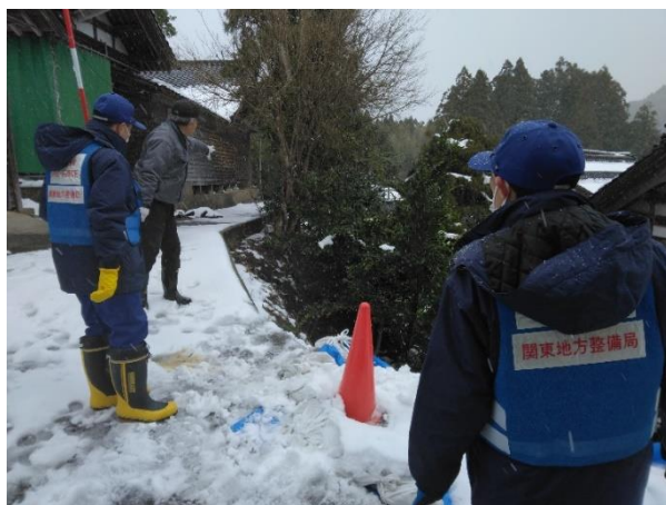
被災状況調査(志賀町東小室)