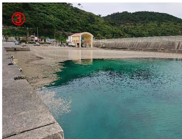
【宜名真(ぎなま)漁港】 大量の軽石を確認