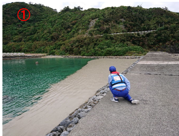
【奥(おく)港】大量の軽石を確認