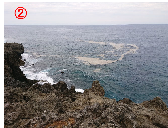
【辺戸(へど)岬】軽石の漂流を確認