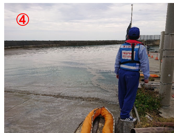
【辺土名(へんとな)漁港】 大量の軽石を確認