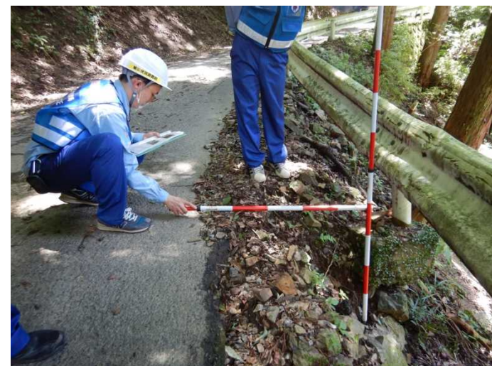
⑤村道 柚木川内日当線 現地調査