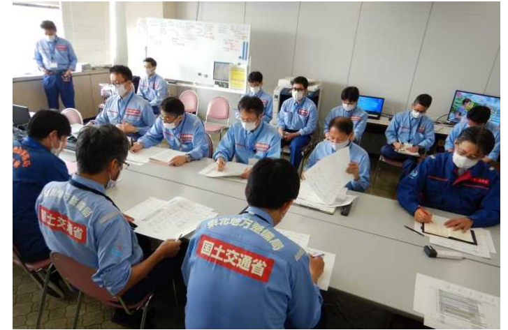
【各地整情報共有会議の状況】