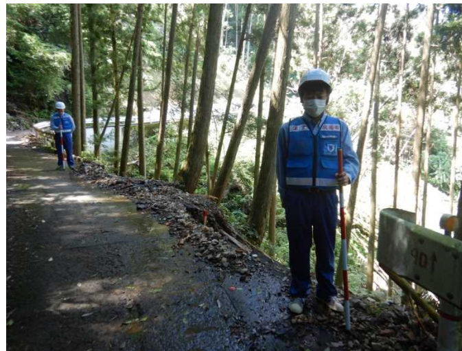
⑤村道 柚木川内日当線 現地調査