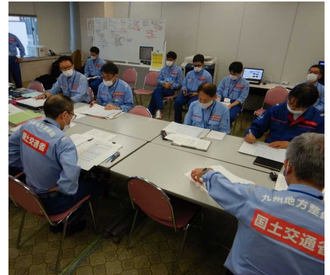
【各地整情報共有会議の状況】