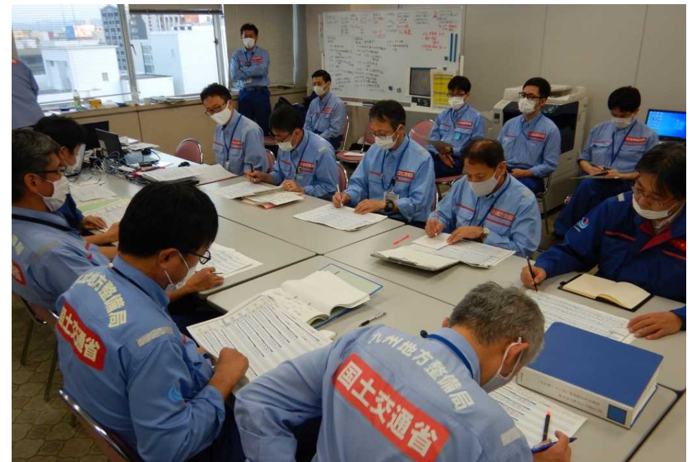
【19:00 各地整情報共有会議の状況】