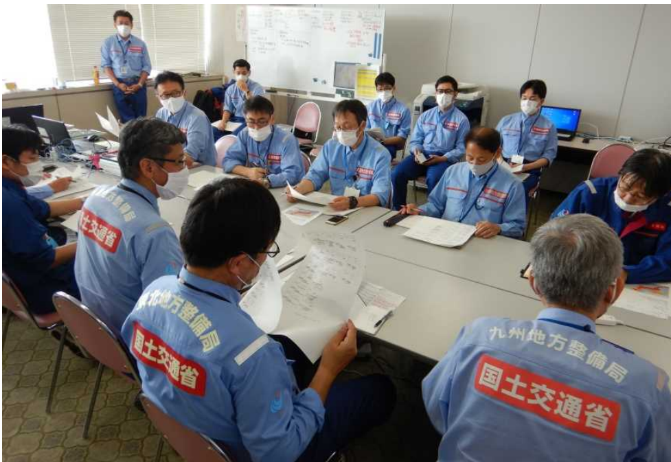
【9:00 各地整情報共有会議の状況】