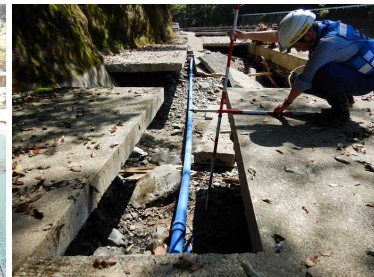
⑥村道 県道向鶴線 現地調査