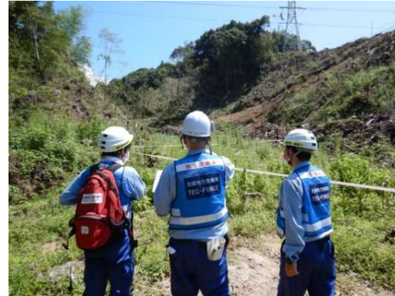
一丸地先 現地状況 (砂利流出状況確認)