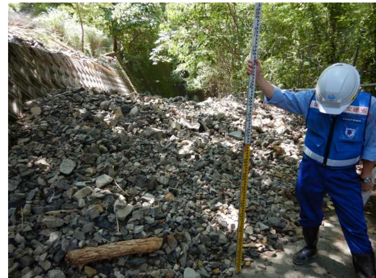
④村道 側道15号線 現地調査