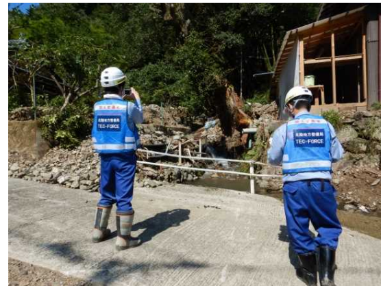
瀬渡地先 現地状況 (土石流被災状況確認)