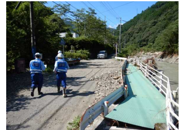
屋形地先 現地状況 (河川洪水による集落の被災状況把握)