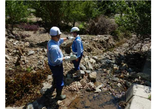
濁毛地先 現地状況 (土石流被害状況把握)