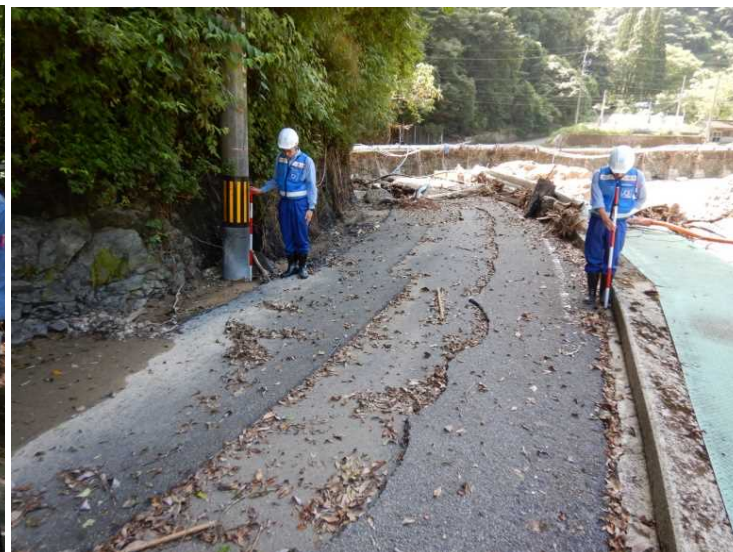
⑤村道 向鶴小鶴線 現地調査