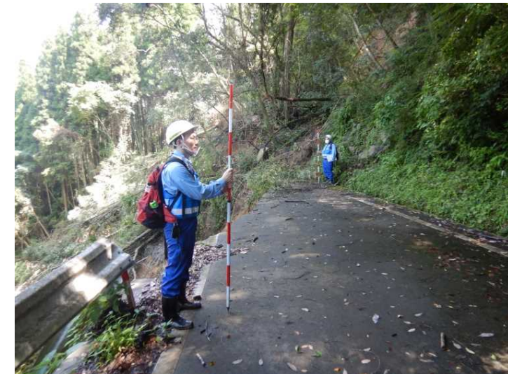
①村道 岩ヶ野下払線 現地調査