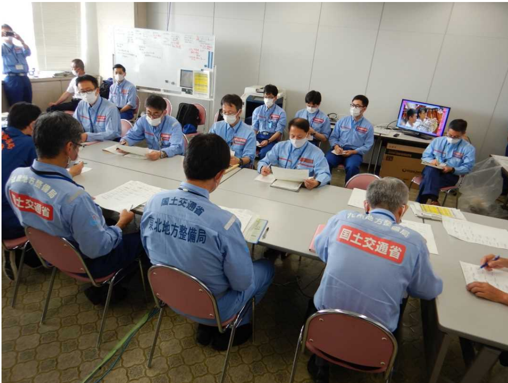
【各地整情報共有会議の状況】