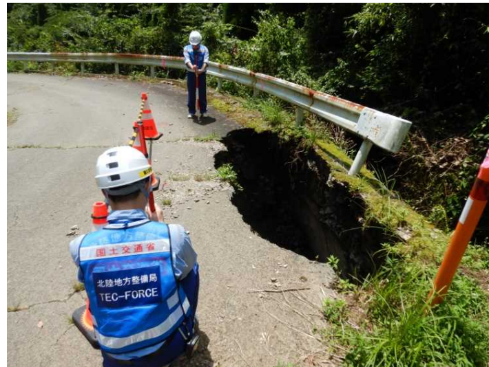
③村道 大河内萩線 現地調査