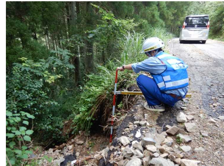
⑤村道 涼松横手線 現地調査