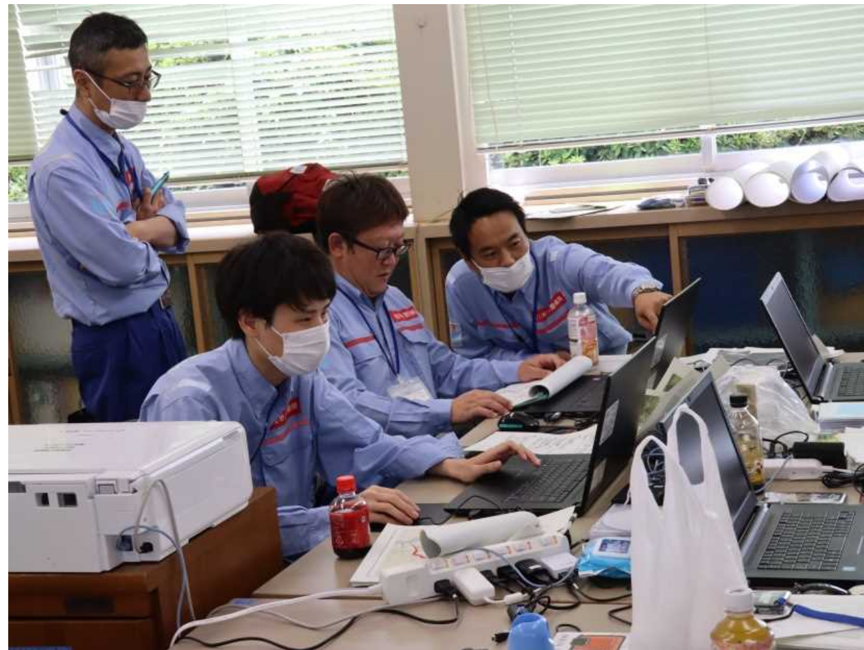
九州地方整備局との打合せ