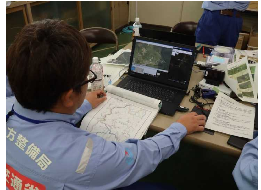
ヘリ映像による被災状況の確認