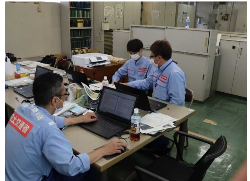
球磨村への報告資料作成