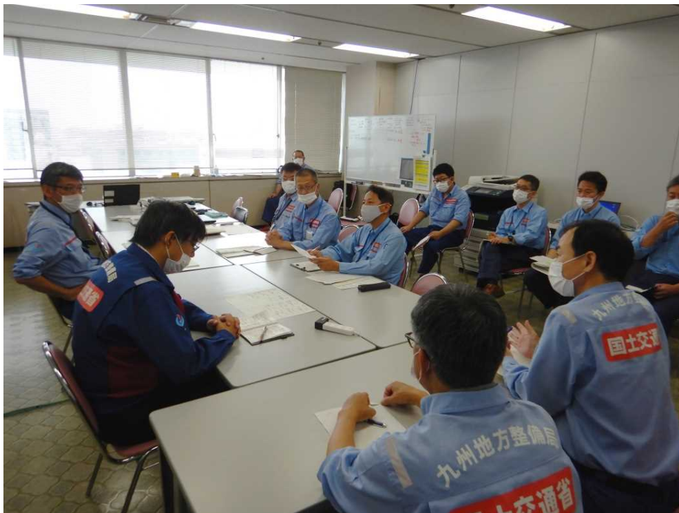
【9:00 各地整情報共有会議の状況】