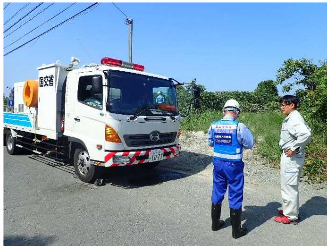
ポンプ車設置確認 (大牟田市 新開地区)