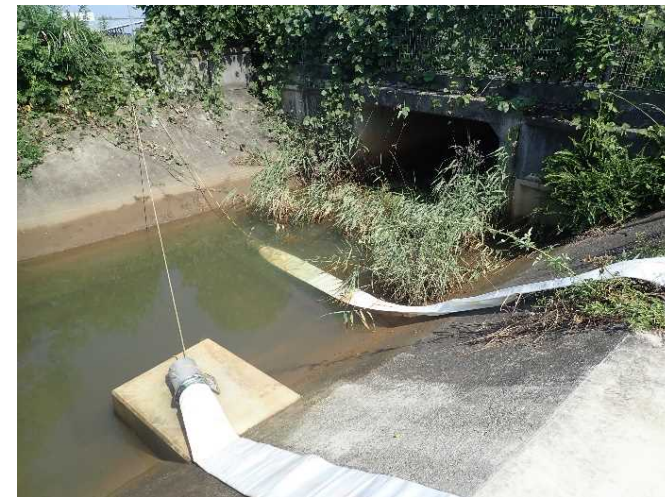
排水ポンプ設置確認 (大牟田市 新開地区)