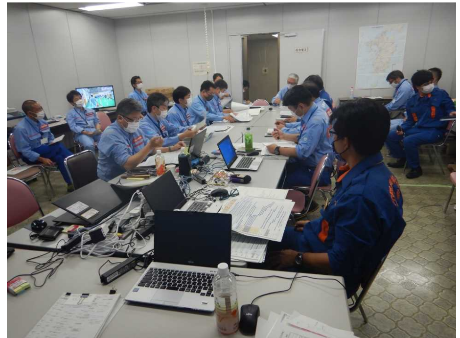
【各地整情報共有会議の状況】