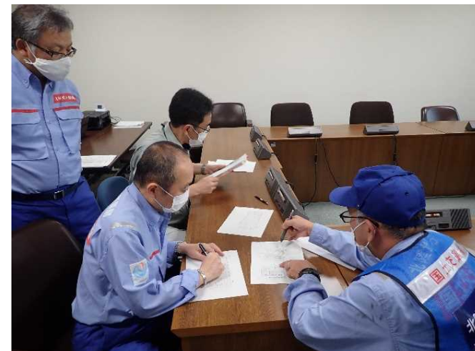
九州地整リエゾンへ設置完了報告 (大牟田市役所)