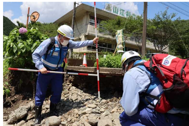
④村道 神園城内線 現地調査