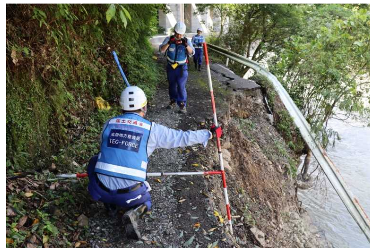
⑤村道 荒神光永恵線 現地調査