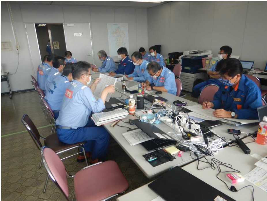
【各地整情報共有会議の状況】