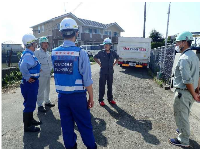
ポンプ車設置確認 (大牟田市 三川ポンプ場)