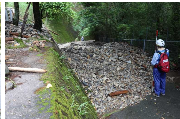
①村道側道15号線 現地調査