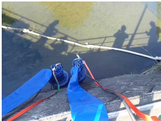
排水ポンプ設置箇所確認 (大牟田市 三川ポンプ場)