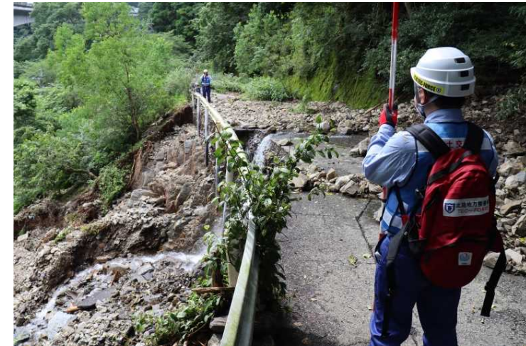
①村道側道15号線 現地調査