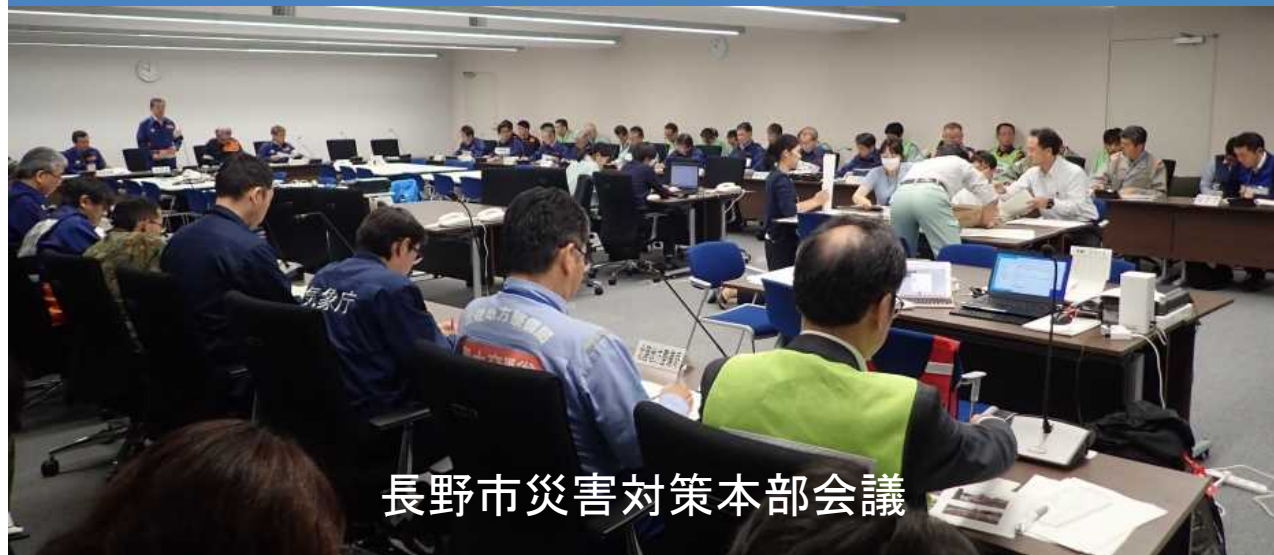
長野市災害対策本部会議