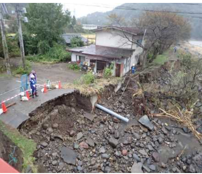
境橋下流左岸 被災状況