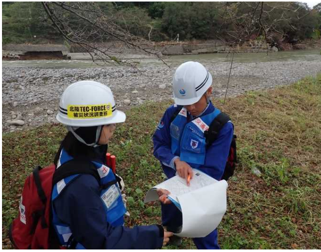
大屋橋上流右岸 被災箇所確認