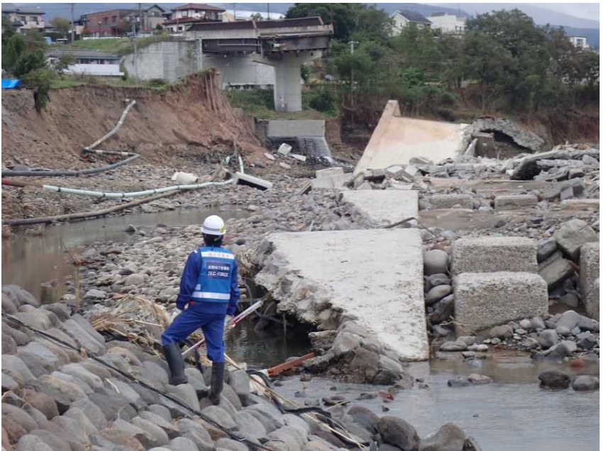
海野宿橋 被災状況