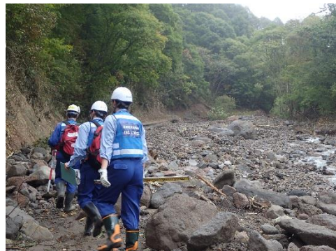
▲現地調査(上田市真田町長地先) [砂防第1班(松本)]