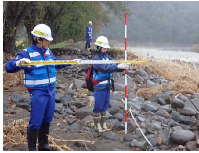
境橋下流左岸 被災箇所測量