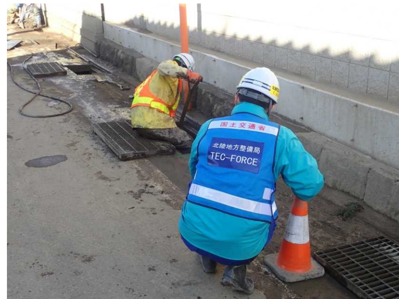
側溝清掃 (県道368号 村山豊野停車場線)