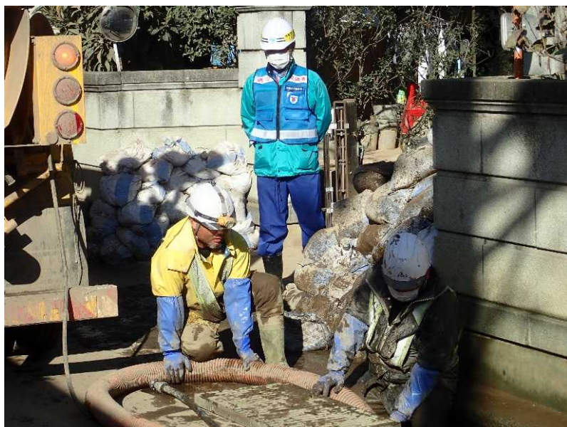
側溝清掃 (県道368号 村山豊野停車場線)