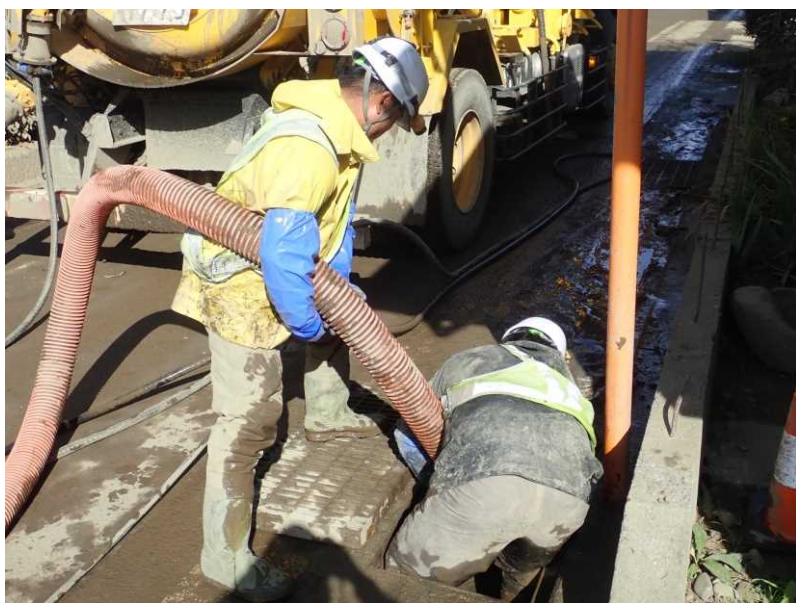
側溝清掃 (県道368号 村山豊野停車場線)