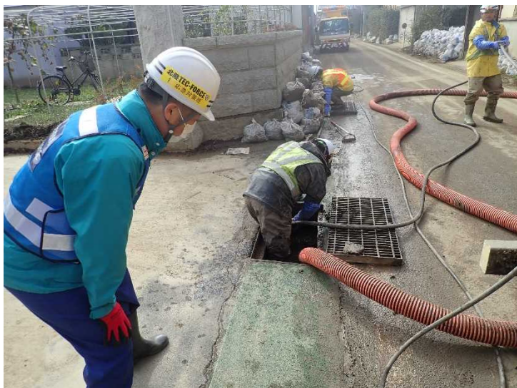
側溝清掃 (県道368号 村山豊野停車場線)