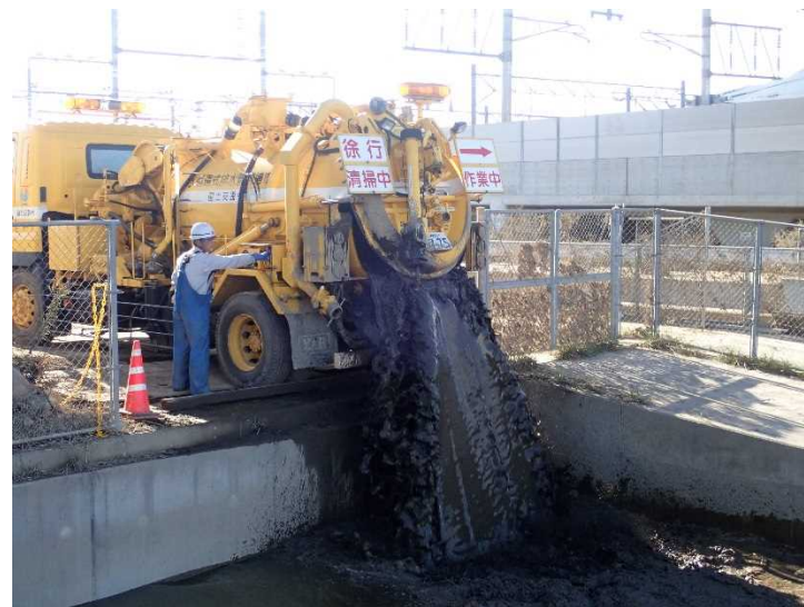
側溝清掃 (土捨て場)