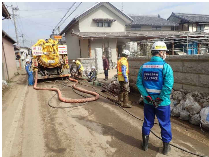
側溝清掃 (県道368号 村山豊野停車場線)