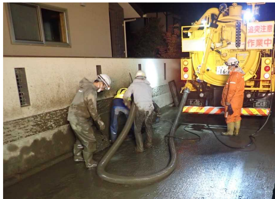
側溝堆積状況 (県道368号村山豊野停車場線)