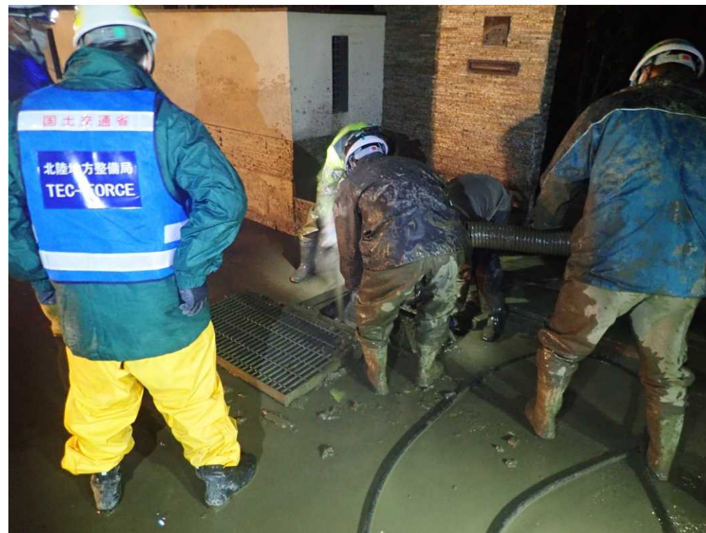
作業箇所確認 (県道368号村山豊野停車場線)