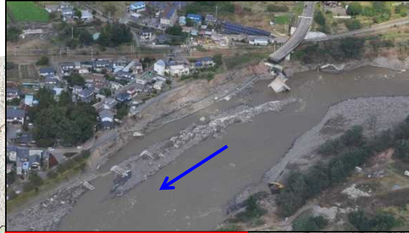
【千曲川：護岸崩壊・橋梁被災】 長野県 東御市 海野 地先～田中 地先