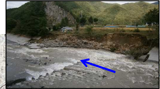
【千曲川：護岸崩壊】 長野県 小海町 千代里 地先～東馬流 地先