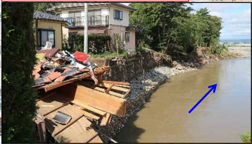
【千曲川：護岸崩壊】 長野県 佐久市 原地先～佐久穂町 高野町 地先