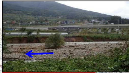
【夜間瀬川：護岸崩壊】 長野県 中野市 笠原 地先