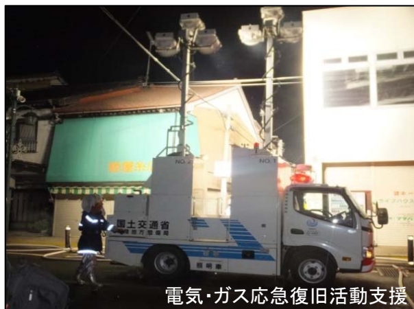
電気・ガス応急復旧活動支援