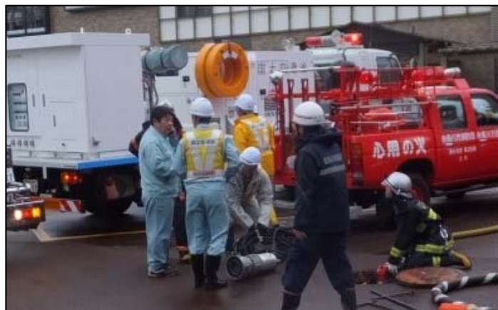
排水ポンプ車活動状況