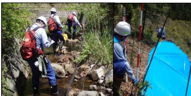
被災状況調査班(砂防)(河川)