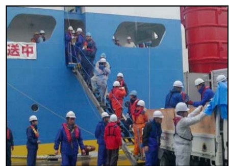
白山による緊急物資輸送