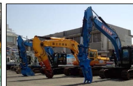
遠隔操縦式バックホウの貸出