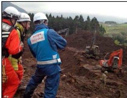
高度技術指導班 (土砂災害対策アドバイザー)