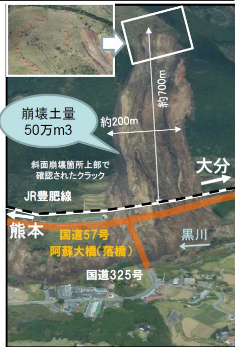
阿蘇大橋地区土砂崩落状況