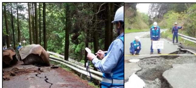
被災状況調査班(道路)