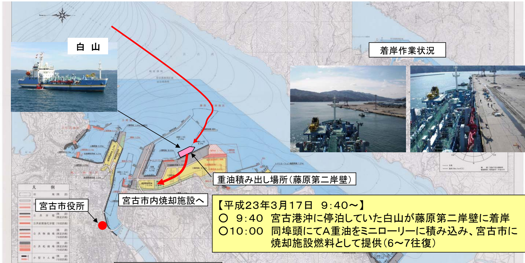
重油積み出し作業状況