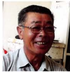
長岡市陽光台仮設住宅