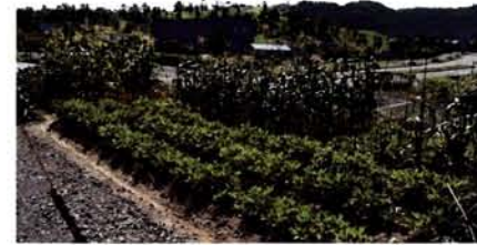
仮設住宅脇で育てている作物

ときどき山古志の自宅に行きますが、地震前は、美しく整えられていた田畑だったのですが、今では人の背丈よりも高い草がぼうぼうと生えていて、見る影もありません。あの日から2年近くが経過しましたが、私たちは山古志に戻ろうと思っています。そのためには乗り越えなければならない課題もありますが、みんな力で合わせてやれる限りの準備を進めていきたいと思ひます。山古志の冬は雪が多くて厳しいのですが、それだけに春を迎える喜び、作物や草花を育てる楽しみがあります。その中で、集落の人たちとお酒を酌み交わしながら、心おきなくおしゃべりをする。そんな日が来ることを信じて、みんなががんばっていきたくと思っています。