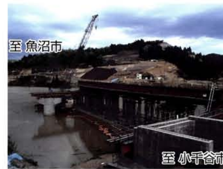
P2橋脚～A2橋台間架設状況 平成18年5月19日

現在、床版工事が完了し、橋面上の高欄設置作業を進めています。一日も早い完成を目指して無事故、無災害で工事を進めていきます。