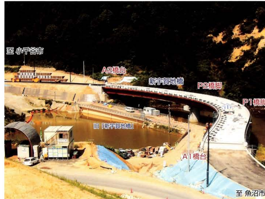
工事箇所全景 平成18年8月10日