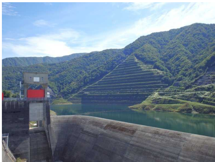
ダム左岸 ロック原石山跡地(県道側)