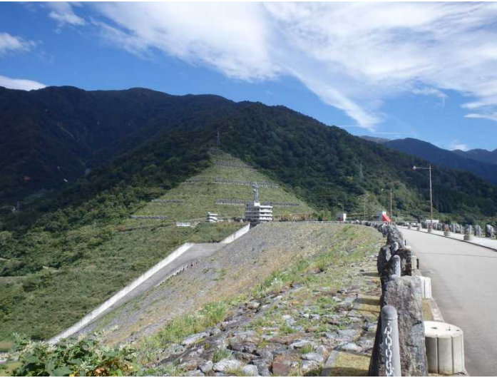
ダム周辺右岸(市道側)