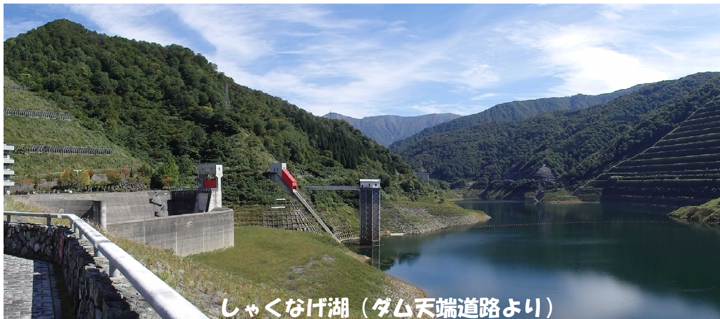
しゃくなげ湖 (ダム天端道路より)