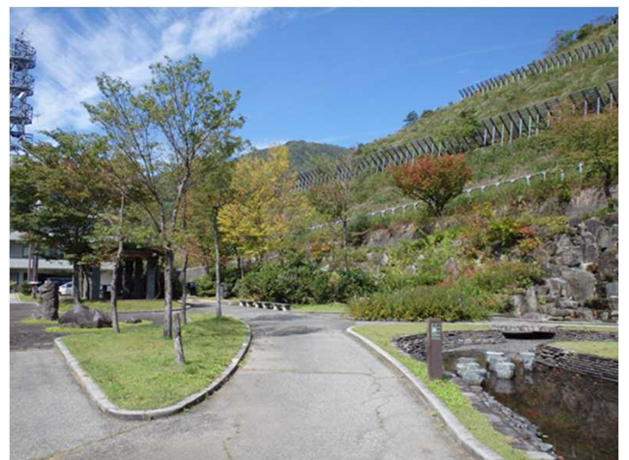
ダム管理所裏の公園