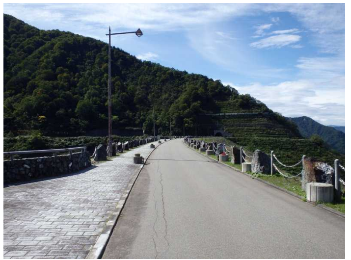
ダム周辺左岸(県道側)