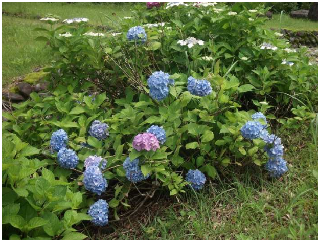
あじさい(十字峡親水公園)