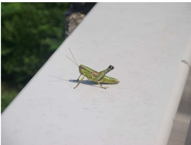
バッタ(ダム堤体にて)