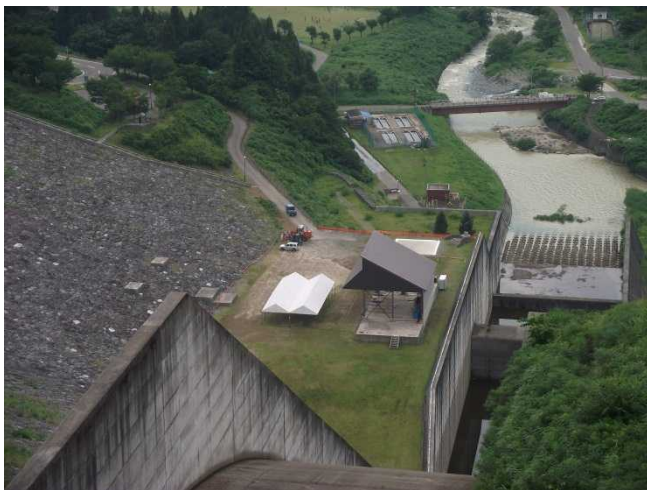
屋外ステージの準備状況 (ダム天端より)