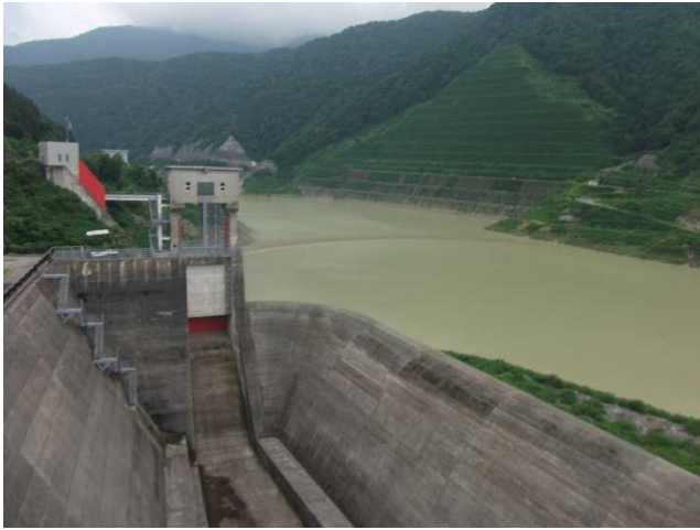
ダム湖の様子(管理所屋上より)