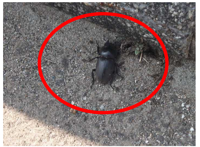
クワガタムシ(ダム堤体にて)