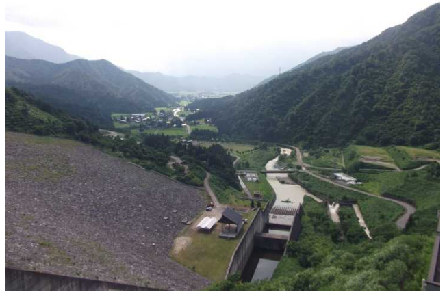
ダム下流の様子(展望台より)