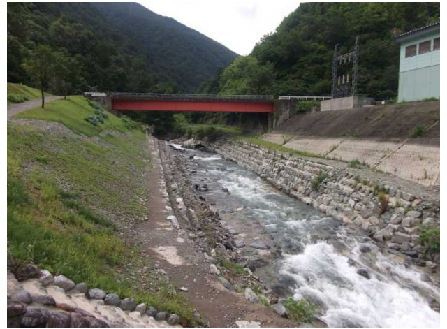
十字峡親水公園の様子