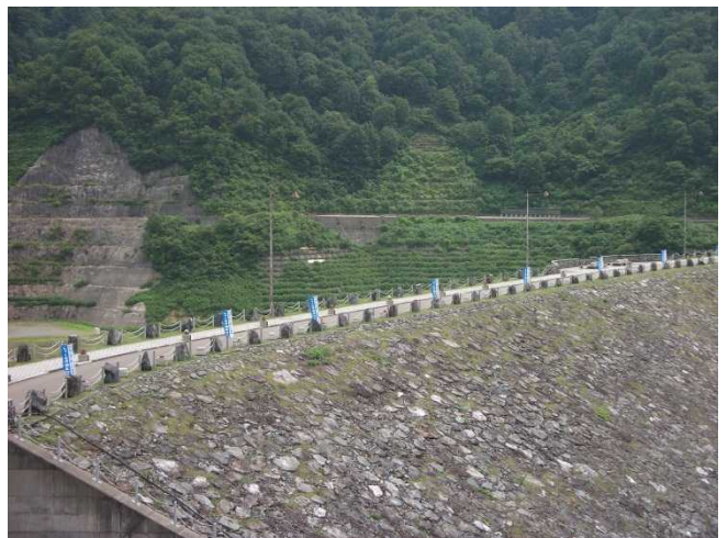
ダム堤体の様子(展望台より)