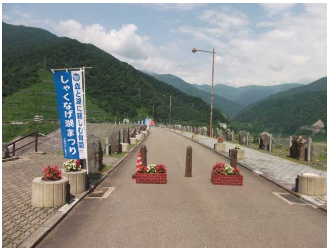
ダム堤体の様子(ダム右岸より)

7月28日には「しゃくなげ湖まつり」が開催されます。先日までの雨の影響でダム湖が濁ってしまっていますが、当日の天候が悪くならない限りは実施する予定です。ダム内の見学や巡視船の試乗もできますので、是非お越しください。