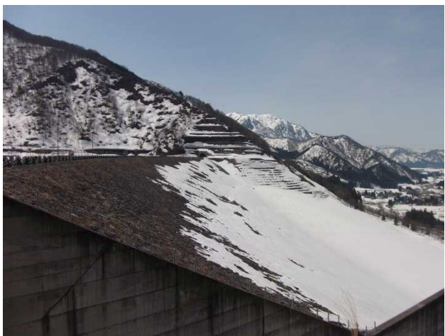
堤体下流側の様子(堤体右岸側より)