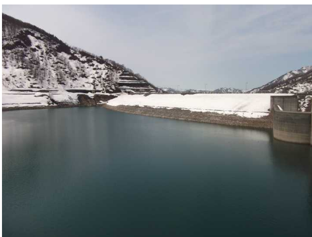
堤体上流側の様子(選択取水塔より)