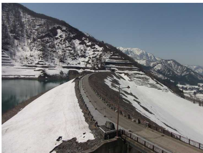
ダム堤体の様子(管理所屋上より)

※現在、県道および市道は関係者以外立ち入り禁止となっております。ご了承ください。