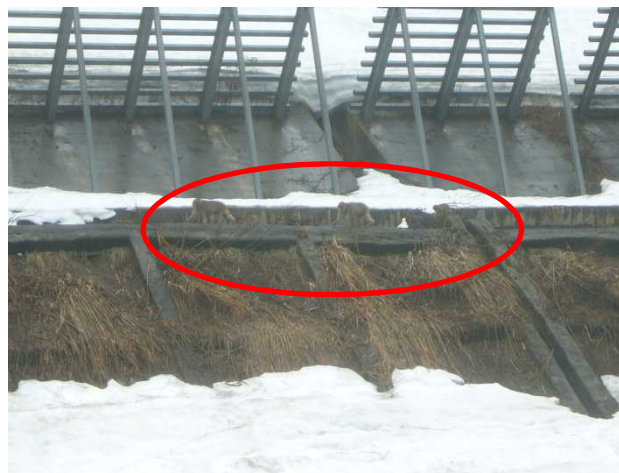
猿の親子出現(4月4日)