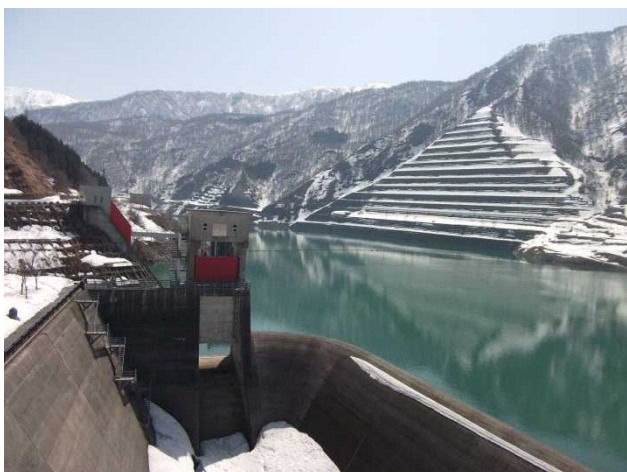
ダム湖の様子(管理所屋上より)