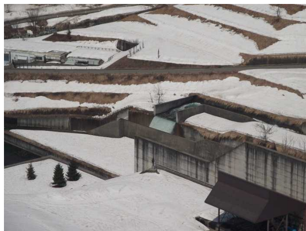
ダム放流口の様子(堤体より)