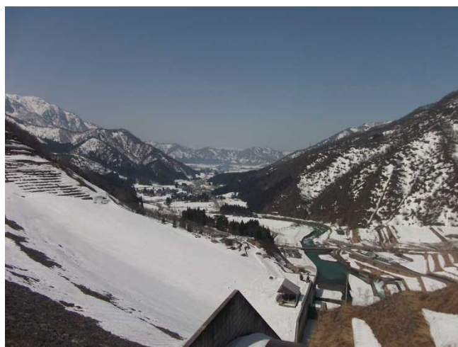
ダムより五十沢を望む