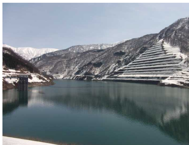
ダム湖上流の様子(堤体より)