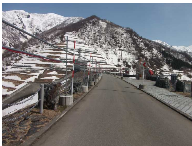
ダム堤体の様子(堤体左岸側より)