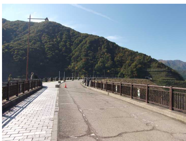
ダム堤体の様子(堤体右岸側より)