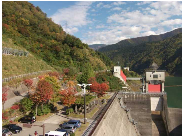
ダム湖上流の様子(管理所屋上より)