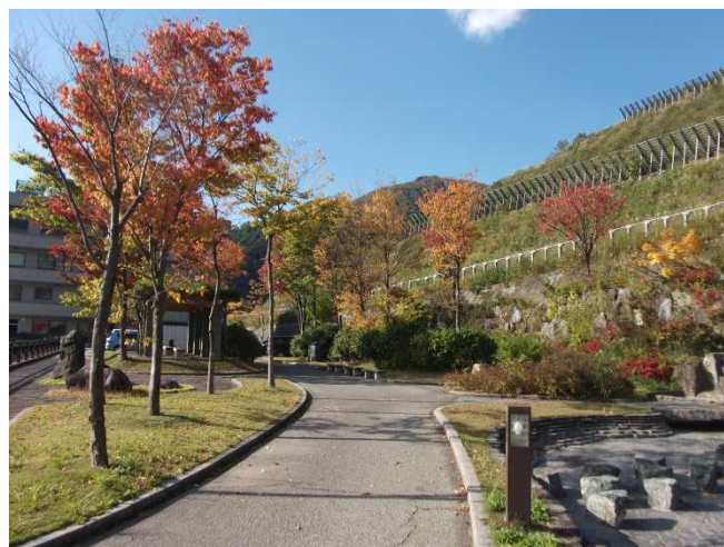
管理所脇の公園の様子