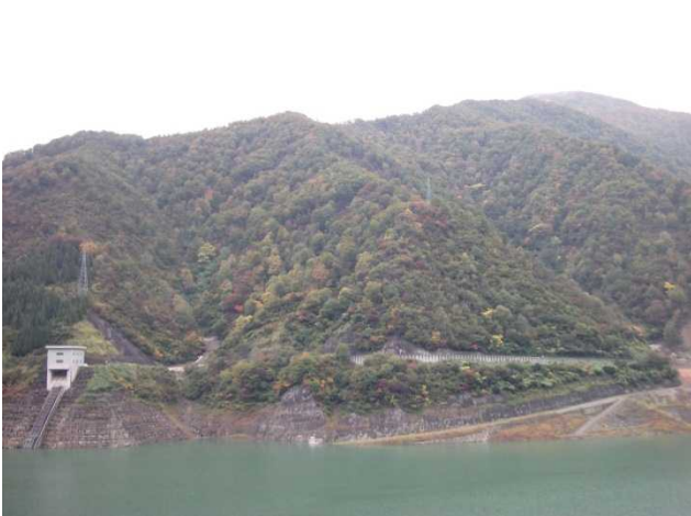
右岸側の様子(あじさい公園より)