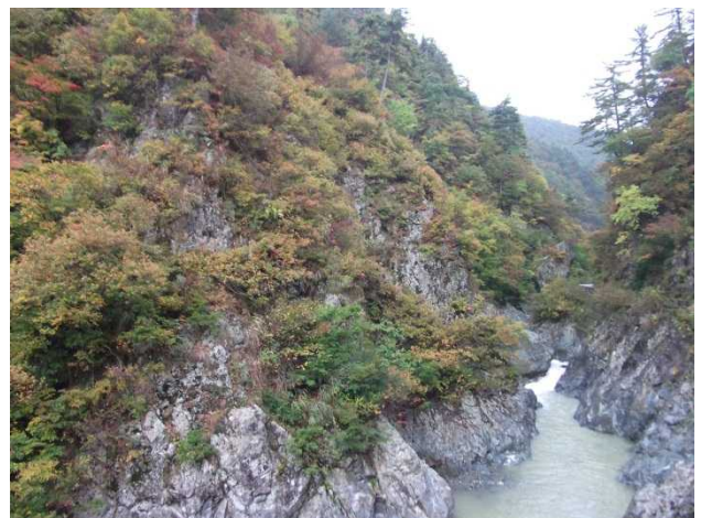
三国川上流の様子