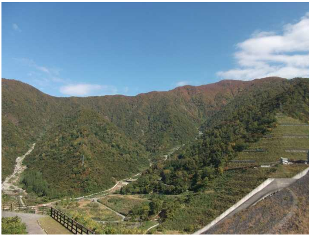
市道の様子(ダム天端より)