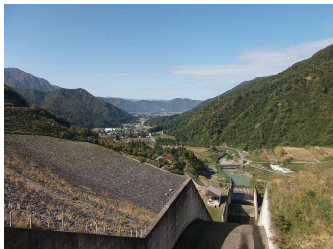
ダム下流の様子(堤体右岸側より)