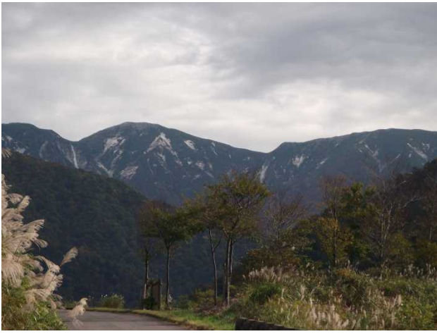
初冠雪(右岸キャンプ場より)