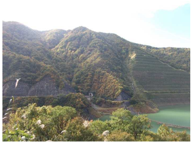
原石山付近(右岸キャンプ場より)