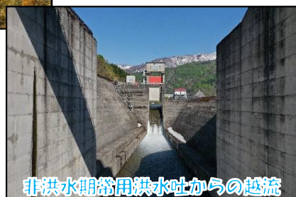
非洪水期常用洪水吐からの越流