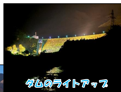
ダムのライトアップ