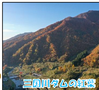
三国川ダムの紅葉