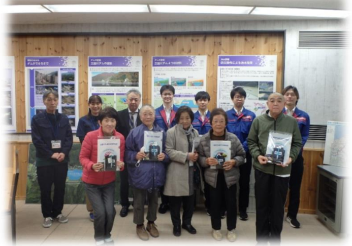
ダム職員と記念に一枚パシャリ☆

記念すべき1000人目の見学者様一行には三国川ダム管理所長からボールペンやシャッピーがプリントされたクリアファイルなどがプレゼントされました！おめでとうございます！！