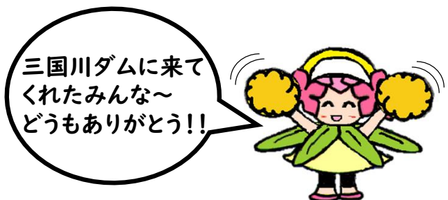
三国川ダムマスコットキャラクター シャッピー