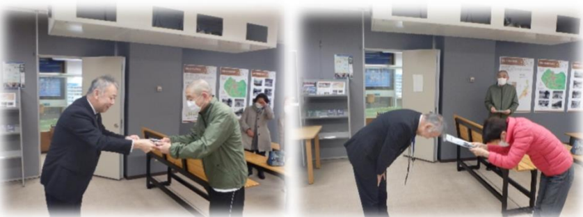
クリアファイルなどをプレゼント！