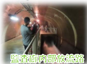
監査廊内部放水路

三国川ダム周辺で開催されるお祭りです!三国川ダム管理所では監査廊(地下通路)を開放し自由に見学をすることができます!!その他わたあめやかき氷の販売、ダムの下流域では魚のつかみ取りや木工教室をおこなっています!