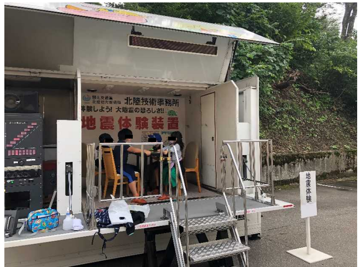
地震体験装置の体験状況