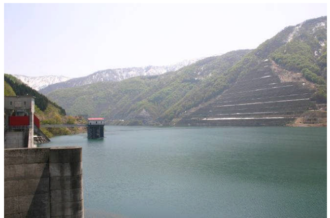
5月連休時のダム湖(平常時最高水位) 貯水位427m