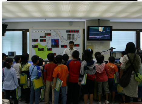
●職員が管理所操作室の説明をしている様子