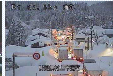
H30. 2. 6