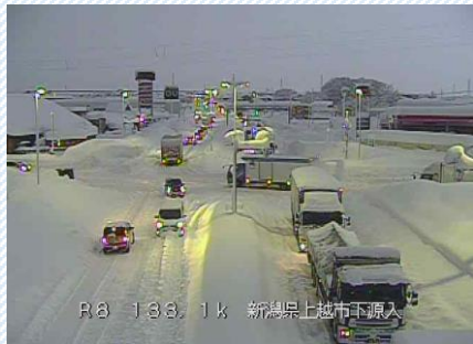
R3. 1. 10