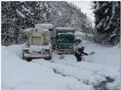
H30. 2. 6