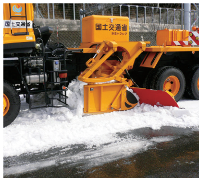
路面整正装置(サイドシャッタ付)

路面に降り積もった雪が、通行車両に踏み固められると、圧雪になります。これが気温の上昇や車両のわだち掘れなどのため圧雪に凸凹が生じ、車両の通行に支障をきたします。路面整正作業は、路面の圧雪を除去、または圧雪の凹凸を削り取ることで平滑に仕上げ、通行車両の安全を確保することを目的に行います。