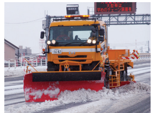
路面整正装置による圧雪の除去