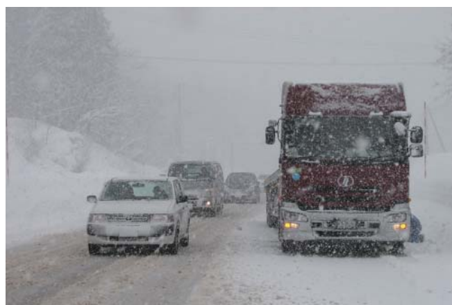
④チェーン装着による交通への影響