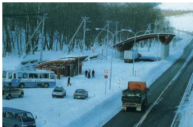
③屋根付きチェーン着脱場