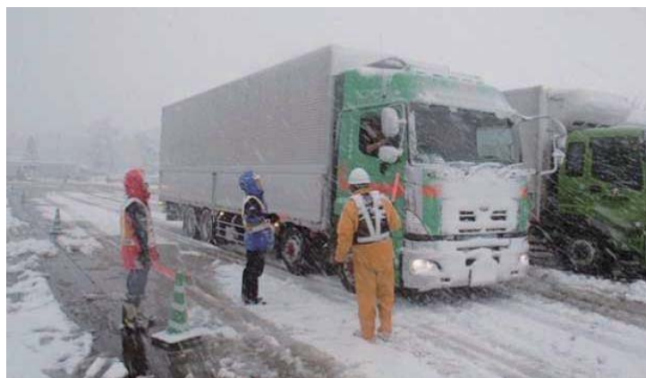
②高速道路のチェーン着脱場