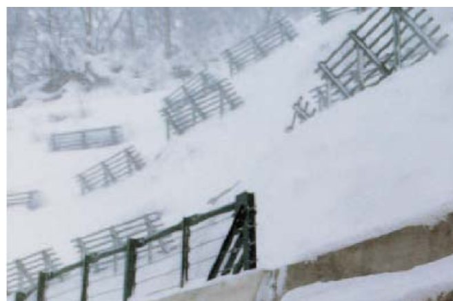
②スノーブリッジ型雪崩予防柵