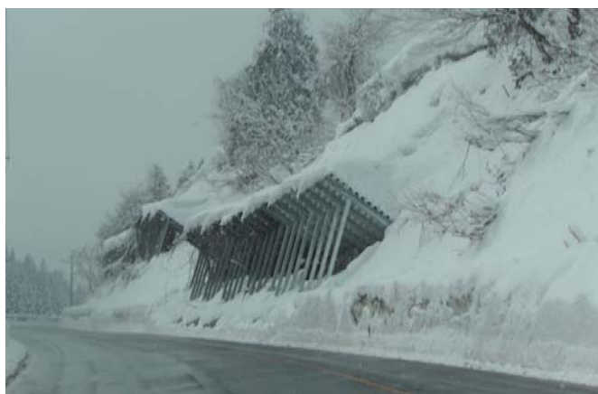
①スノーブリッジ型雪崩予防柵