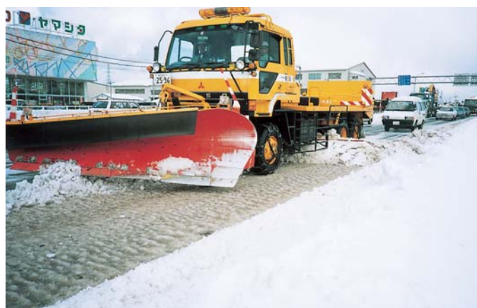
除雪トラックによる作業