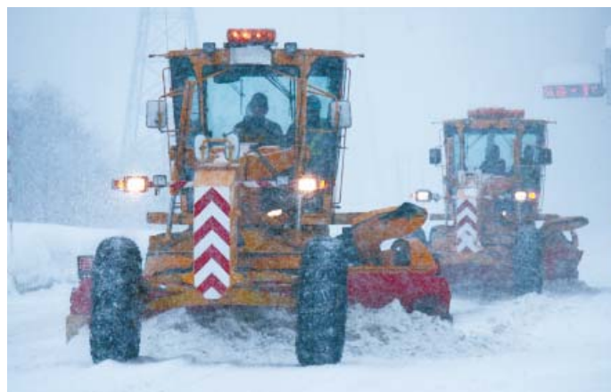
除雪グレーダによる作業