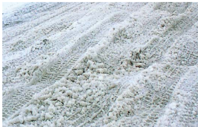
凹凸になった路面