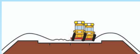
除雪トラックや除雪グレーダによる作業