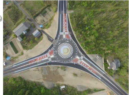
○田上あじさい交差点