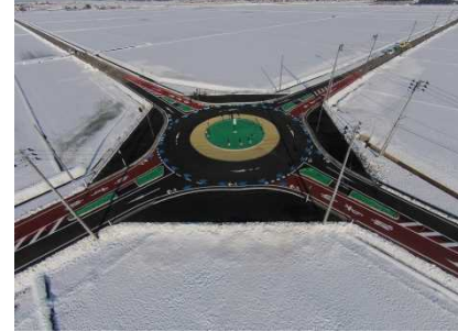
○大聖寺上福田町岡野第1交差点、第2交差点