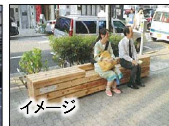
②: 犀川大橋のライトアップ、オープンカフェ、ベンチ設置