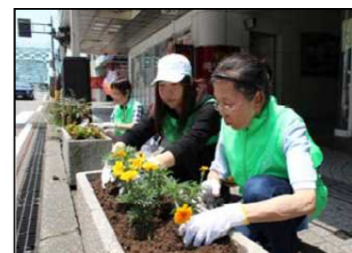
①: 歩道清掃、花壇の植え替え