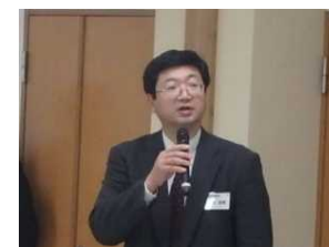
岩見道路部長挨拶