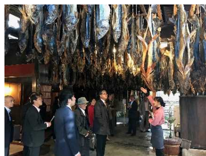
町屋散策(千年鮭 きっかわ)