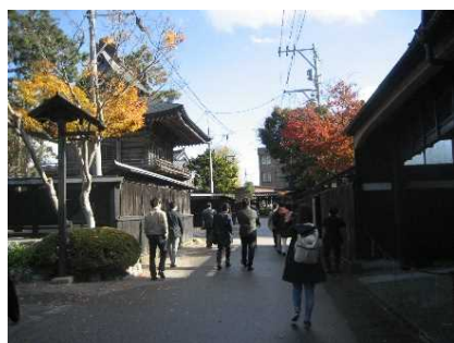
町屋散策(黒塀通り)