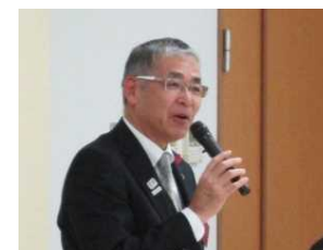
高橋村上市長挨拶