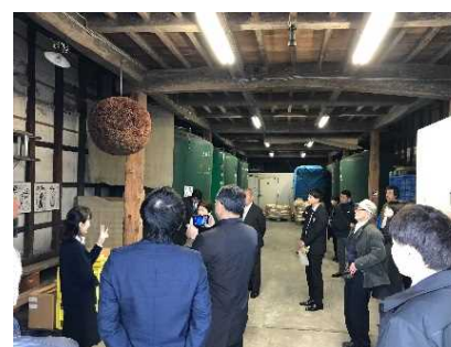
町屋散策(大洋酒造)