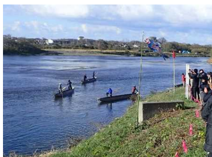
三面川「鮭の居繰網漁」