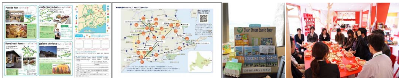
シーニックカフェマップ

これらの活動内容は、年 2 回程度シーニックカフェスタッフミーティングで決めており、20 代のカフェスタッフが中心となり、企画や実施体制の具体的検討を行っています。