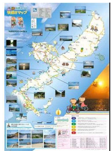
自転車版快適さマップ (全体版)