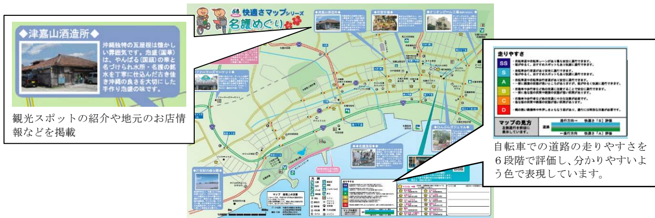
自転車版快適さマップ (ローカル版)

URL : http://www.tour-de-okinawa.jp/sukumichi/log.html#h21map