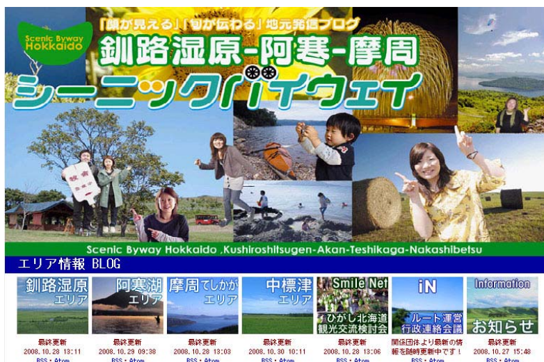
ルート HP トップ画面