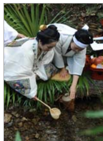
▲お水取り（辺戸地区）

メンバーと地元有志が、再びこの伝統行事の復活に取り組みました。南部パートナーシップでは、さらなる琉球歴史ロマン街道の魅力を発掘する取り組みとして、「首里城お水取り」の行事への支援を行ないました。平成20年にはその取り組みが認められ、第11回日本水大賞の審査部会特別賞を受賞しました。