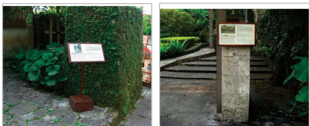
▲首里城周辺の説明板