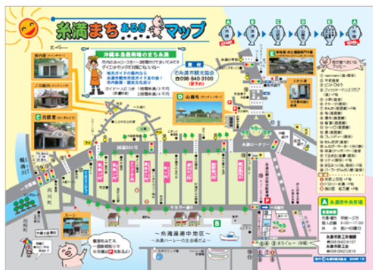
▲糸満まちあるきマップ