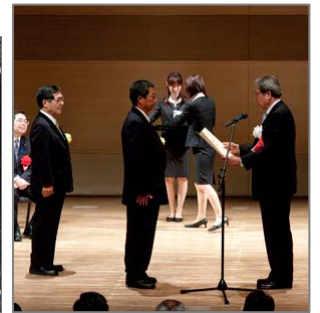
▲日本水大賞表彰式（平成20年6月）