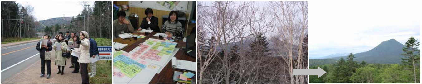
景観づくり検討会の様子(フィールド調査・意見交換)

ました。今後も、関係機関への働きかけを含め、プラン推進に向けた活動を積極的かつ継続的に実施します。