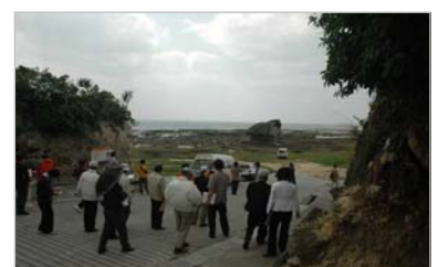
▲景観点検ツアー（平成19年3月）

南部地域には、有名無名の様々な旧跡があり、有名なものについては色々な文献で紹介されている一方、地元の人しか知らない魅力的な場所が数多くあります。そこで無名スポットを発掘し、これらスポット巡りをする事で課題を洗い出す景観点検ツアーを実施しました。