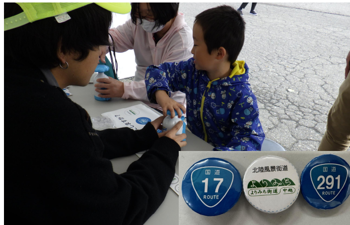
缶バッジ作成体験