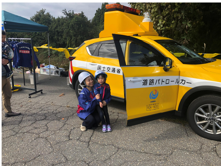
パトロールカーと記念撮影