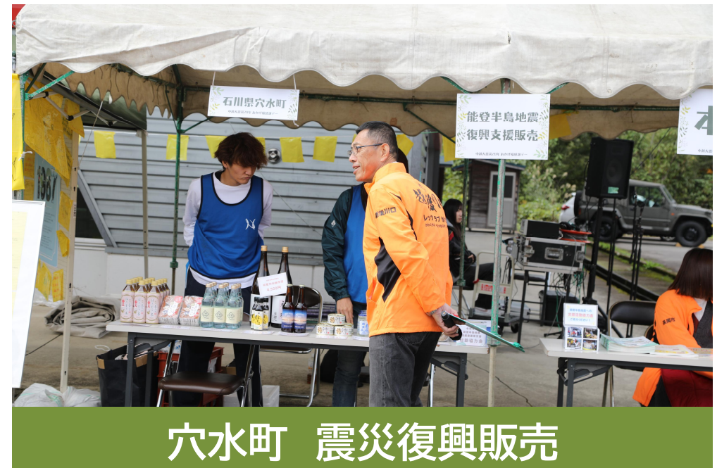
穴水町 震災復興販売