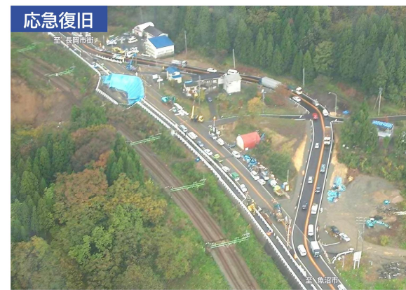
中越地震パネルの展示