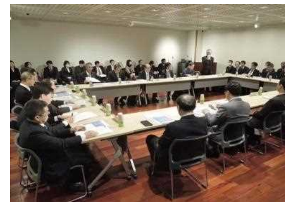
水辺からはじまる生態系ネットワーク全国会議 (主催:国土交通省 運営:(公財)日本生態系協会)