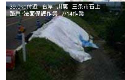
39.0kp付近 右岸 川裏 三条市石上 路肩・法面保護作業 7/14作業