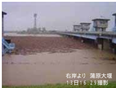
右岸より 蒲原大堰 13日16:29撮影