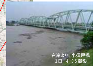
右岸より 小須戸橋 13日14:35撮影