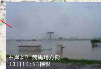
右岸より 競馬場方向 13日15:53撮影