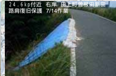
24.6kp付近 右岸 田上町曾根田新田 路肩復旧保護 7/14作業