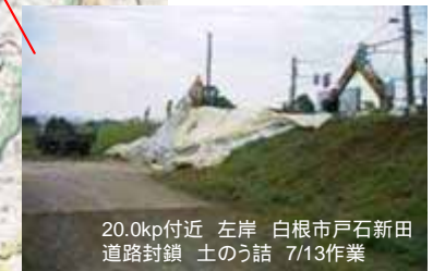
20.0kp付近 左岸 白根市戸石新田 道路封鎖 土のう詰 7/13作業