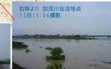
右岸より 加茂川合流地点 13日15:06撮影