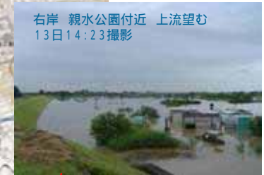
右岸 親水公園付近 上流望む 13日14:23撮影