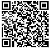
No.14乗り場時刻表 (新潟交通バスHP)