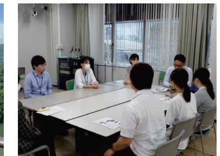
若手職員との座談会