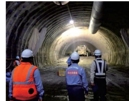
トンネル工事見学

北陸地方整備局では、大学等に在籍する技術系(土木、建築、電気、機械等)の学生を対象として、学生の夏期実習(インターンシップ)を毎年受け入れています。河川・道路・港湾/空港・建築分野など、ご希望に合わせた実習先で、国ならではの規模な事業に携わりながら様々な業務を体験できます!(例年5月初旬～6月初旬に募集。開催日程・実習内容については決まり次第、HPやSNS等でお知らせします。)