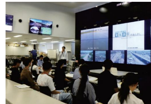
災害対策室の見学

北陸地方整備局では、個別業務説明会や庁舎見学など、様々な説明会を実施しています。個別業務説明会では、皆様のご希望の日時や方法(対面・Web)に合わせて柔軟に対応可能です。どんな質問にも全力でお答えしますので、興味のある方はお気軽にご参加ください。