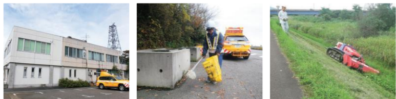
出張所 道路パトロール 河川敷の除草